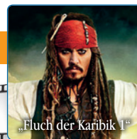
„Fluch der Karibik 1“

19.30 Uhr Open-Air-Kino-Picknick mit dem Kultfilm „Fluch der Karibik 1“ (im Rahmen des Bürgerhaushaltes)