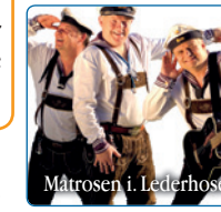
Matrosen i. Lederhose

Wir machen Stimmung von maritim bis alpin, quer durch's Land! Der Name ist Programm – für alle Schlager- und Volksmusikfans!