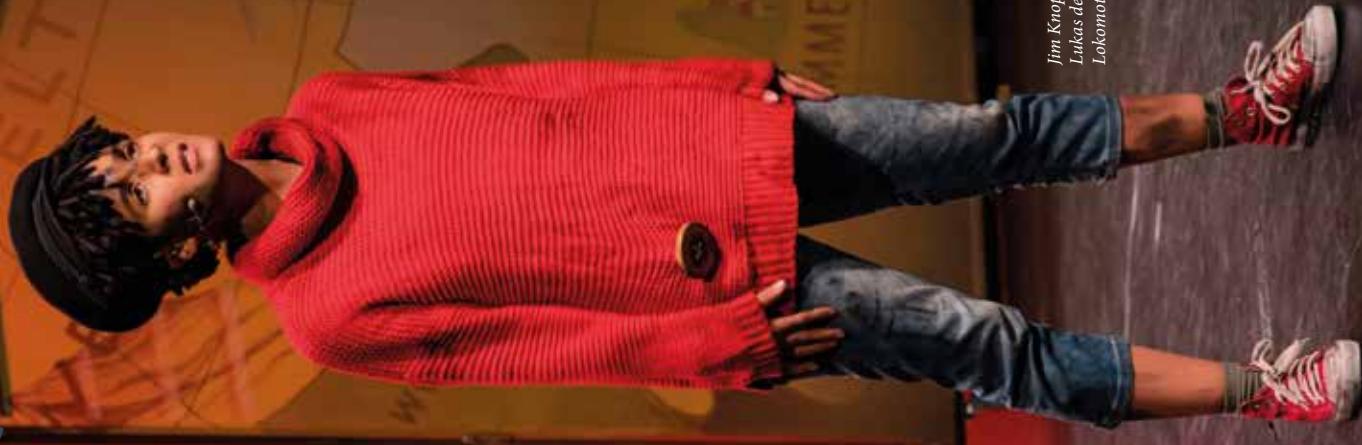
Jim Knopf & Lukas der Lokomotivführer