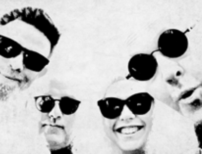
Crazy Sally