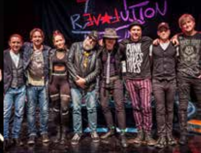
Der Udonaut und die Paniker