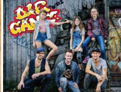
DIE GÄNG