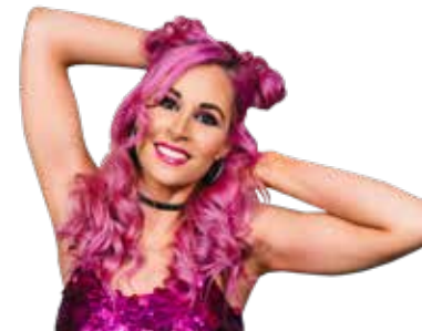
Undine Lux © Moritz Künstler