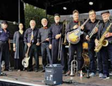
6 Richtige