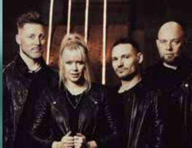
Die Lärmer