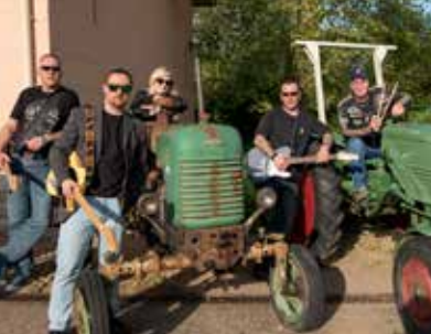
One horse town