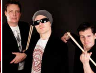
Stamping Feet © Sven Hertrampf