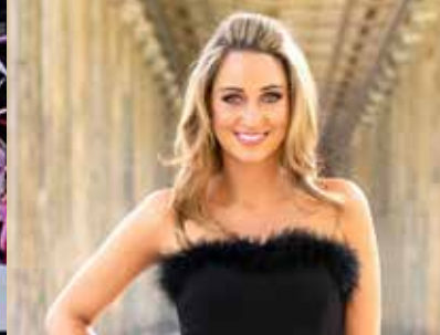
Madeline Willers