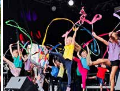
Hort der großen Biber