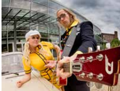
Frühstücksbeat © Mirko Majchrzaki