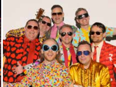
Die barmherzigen Plateausohlen